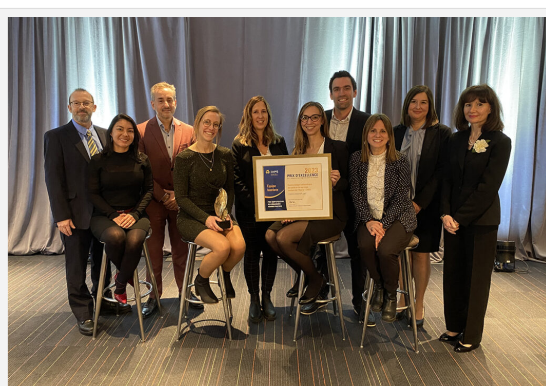
Quelques personnes représentant l'établissement se sont rendues à Québec jeudi dernier pour recevoir le prix.